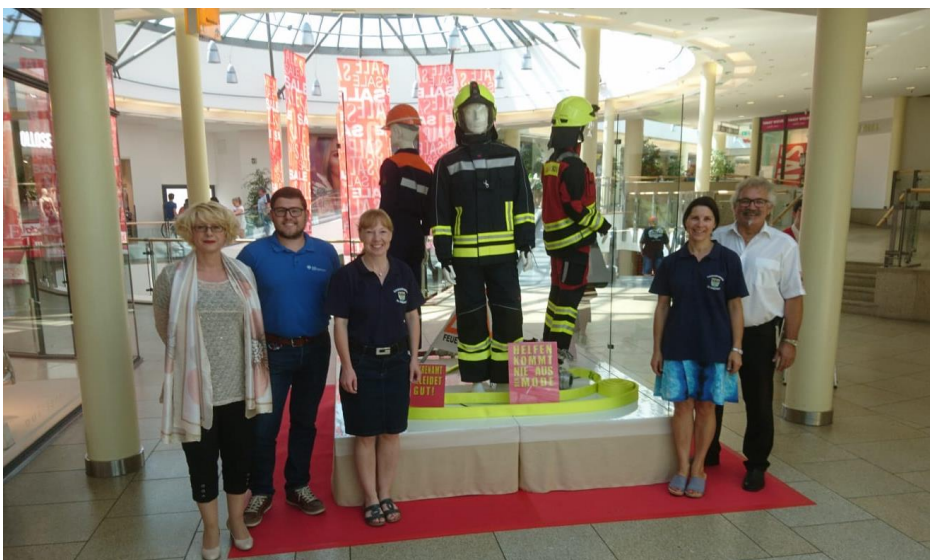
Ausstellung von Feuerwehrkleidung im Degg's Einkaufscenter

Die Freiwilligen Feuerwehren sind auf der Suche nach Mitgliedern. Viel wird die Jugend beworben und dazu einiges geboten. In den Aktionswochen möchten wir diesmal darauf hinweisen, dass man der Feuerwehr auch aktiv beitreten kann, wenn man nicht mehr in die Jugendgruppe passt. Daher werben wir diesmal speziell um Quereinsteiger - und es dürfen gerne auch mehr Feuerwehrfrauen werden!